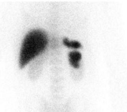
FIGURA 3. Gammagrafía hepato-esplénica con hematíes desnaturalizados marcados con ^{99m}\text{Tc} .

Ante el hallazgo de masas de origen desconocido, fundamentalmente en la cavidad peritoneal, debe ser tenida en cuenta la posibilidad diagnóstica de esplenosis, sobre todo si existe un antecedente de lesión esplénica traumática o quirúrgica. Para su diagnóstico se pueden emplear pruebas no invasivas elevada especificidad, como la gammagrafía hepato-esplénica, la gammagrafía esplénica con hematíes desnaturalizados, o la RM con ferumóxido, evitando exploraciones quirúrgicas innecesarias.