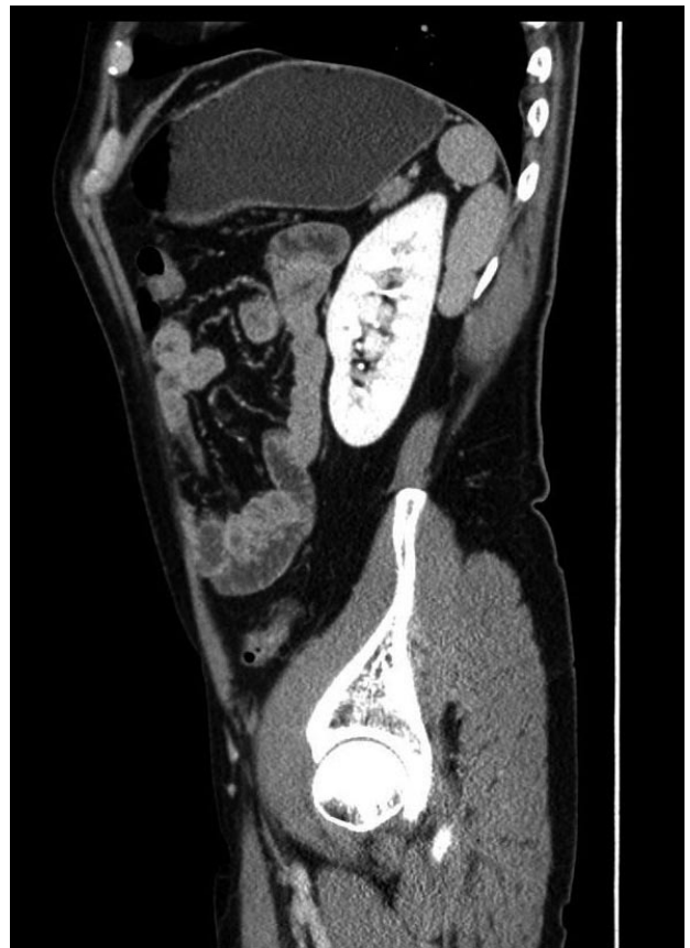
FIGURA 2. TC abdomino-pélvico. Corte sagital.

El término esplenosis hace referencia a la existencia de tejido esplénico viable y funcionalmente activo fuera de su localización anatómica habitual, secundaria a procesos traumáticos o quirúrgicos sobre el bazo, que permiten la siembra de pequeños fragmentos del mismo. Descrito por primera vez por Buchbinder y Lipkoff en 1939, suele presentarse en un 26-67% de los pacientes tras traumatismo asociado con rotura esplénica o tras esplenectomía (2,3).